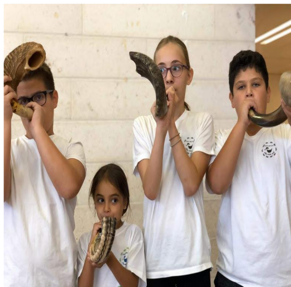
החודש, המועדים והשנה היהודיים